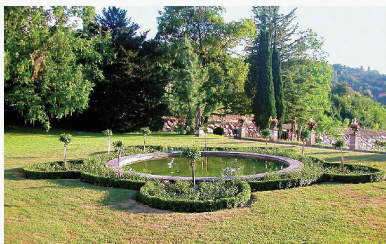
Im heute intakten Teil des Gartens von Schloss Arenenberg