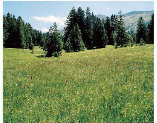
Bild oben: Auerhuhn-Lebensraum Beeriwald mit Leischamm; Bild unten: Flachmoor. In Amden liegen zwei grosse Moorlandschaften und mit 111 ha auch das grösste Moorobjekt des Kantons St. Gallen