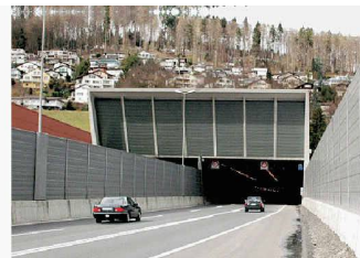
Sonnenbergtunnel: Tunneleinfahrt (oben) und Schema der Anlage (unten)