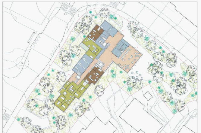
Seniorenzentrum Waltikon: kaskadenartige Abstufung des Baukörpers. Visualisierung, Modellbild, Erdgeschoss (1. Rang, Michael Meier und Marius Hug)

Info-Management Truninger Plot Scan Druck