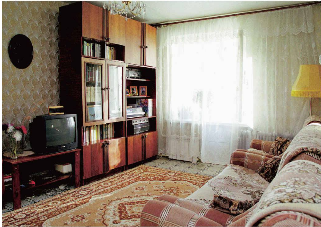
Die Ausstellung zeigt 31 Wohnungen in sechs Ländern. Wohnzimmer in Kazan, Russland