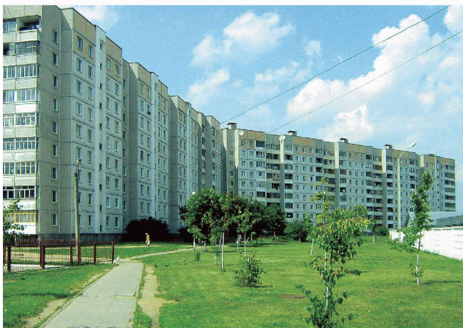
Vertrautes oder fremdes Bild? Plattenbau in Minsk, Belarus/ Weissrussland