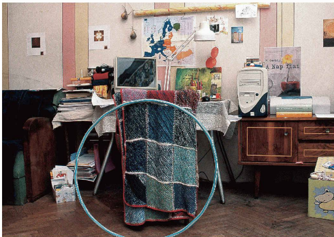
Wie wohnen wir, wie wohnen andere? Eine Lieblingsecke in Klausenburg, Rumänien