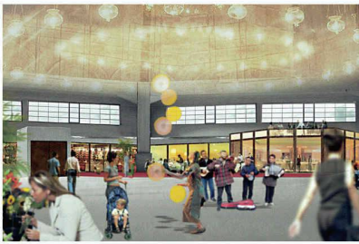
Markthalle von aussen und von innen