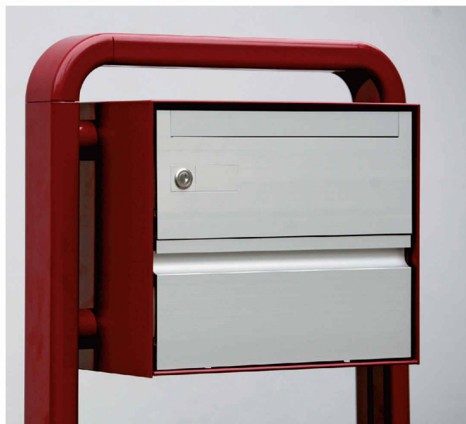
Typ deluxe B - Einzel - Jochstütze

Als Spezialist für Briefkästen möchten wir Ihre Ideen und unsere Erfahrungen verbinden, um eine Lösung mit hohem Nutzwert in Funktion, Design und Preis zu erreichen.