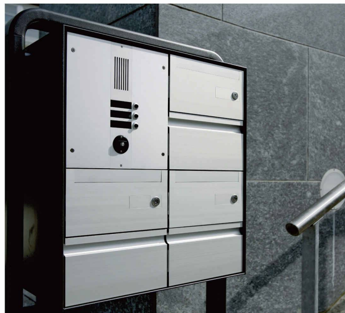
Typ deluxe S - Gruppe - Jochstütze - Sonnerie