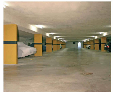
Einstellhalle nach der Sanierung mit Sika-Systemen.

Dazu mussten Zwangstrockner installiert werden. Mit der zweiten Lage, die ebenfalls spritzroh belassen wurde, erhöhte man die Schichtstärke auf 20 mm. Zur Kontrolle der Schichtstärke wurden vorgängig Dachlatten (20 mm) angebracht. Als alternatives Kontrollinstrument könnten auch Einstechnadeln verwendet werden. Abschliessend wurde die letzte Lage von 10 mm aufgetragen und geglättet.