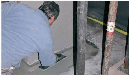
Spachtelung der Stützenfüsse mit Sikagard®-720 EpoCem®

tes Verfahren gewählt. Kleine, lokale Korrosionsschäden wurden wie vorher beschrieben behoben. Daneben wurden die Risse mit Sikadur®-Epoxidharzkleber verdämmt und mit Sika® Injektionsharz verpresst und abgedichtet.