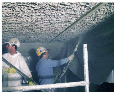
Verarbeitung von Sika-Cafco® 300 im Nassspritzverfahren.

Vor der Applikation des Brandschutz-Spritzputzes wurde die Betonoberfläche gründlich gereinigt, danach wurde der einkomponentige Haftvermittler mit Wasser verdünnt und mittels Roller aufgetragen. Der Haftvermittler soll bei der Applikation des Brandschutz-Spritzputzes klebrig sein, daher muss sowohl der minimalen wie auch der maximalen Trocknungszeit Aufmerksamkeit geschenkt werden. Der Brandschutz-Spritzputz Cafco® 300 wurde in einem Horizontal-Zwangsmischer mit Wasser gemischt. Wichtig ist die Kontrolle der Dichte. Diese wird mit Messbecher und Waage ermittelt. Die Wassermenge und die Mischzeit wurden auf eine Dichte von 670 – 770 kg/m 3 eingestellt. Der Materialauftrag erfolgt im Nassspritzverfahren mit den mörtelüblichen Geräten (wie z.B. Vario Plus der Firma Wilcowa AG). Die verlangte Gesamtschichtdicke von 30 mm wurde in drei Arbeitsgängen appliziert, wobei v.a. bei der ersten Lage (ca. 10 mm Schichtdicke) eine gute Austrocknung von grosser Bedeutung war.