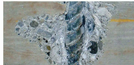
Sondieröffnung an der Deckenuntersicht. Kaum Korrosion trotz geringer Betonüberdeckung.

Bewehrung keine Korrosionsspuren aufweist (Korrosionsgrad 0) was auf den geringen Wassergehalt des Betons zurückzuführen ist. Einzig im Bereich von 2 feuchten Rissen sind die Stähle vollflächig korrodiert (Korrosionsgrad 3).