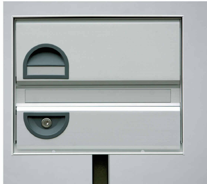
Typ basic B - Einzel - Mittelstütze

Als Spezialist für Briefkästen möchten wir Ihre Ideen und unsere Erfahrungen verbinden, um eine Lösung mit hohem Nutzwert in Funktion, Design und Preis zu erreichen.