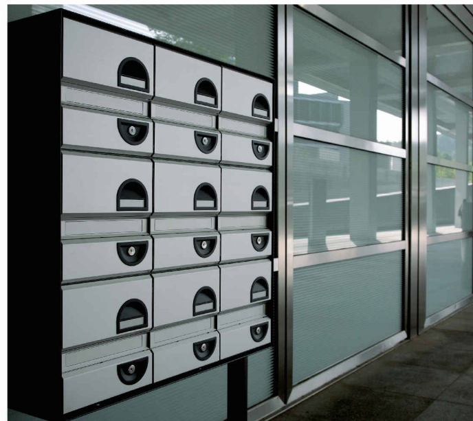
Typ basic S - Gruppe - Seitenstützen