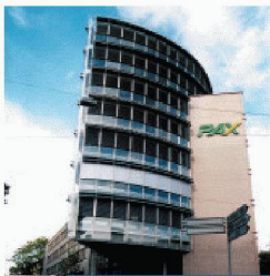
Gewerbe- und Wohnbau