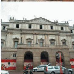
Neubauten in und an bestehenden Bauten

Durch die über 40-jährige Erfahrung und Spezialisierung auf vorbeugende und sanierende Abdichtung gegen drückendes Wasser, sowie ständige Weiterentwicklung der Produkte und Lösungen, können Sie mit RASCOR nur gewinnen.