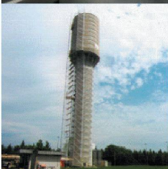
Behälter- und Bäderbau