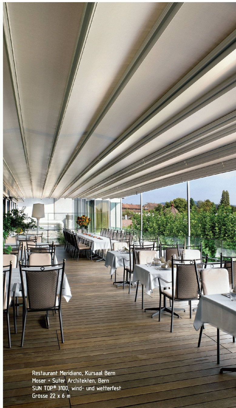
Restaurant Meridiano, Kursaal Bern Moser + Suter Architekten, Bern SUN TOP® 3100, wind- und wetterfest Grösse 22 x 6 m

Tiefbauamt des Kantons St.Gallen, Mai 2007