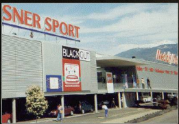
Media Markt, Conthey

Elsäßer produziert mit einer neuen Produktionsanlage. Ihr Vorteil: höchste Präzision, Herstellung und Vertrieb aus einer Hand – just in time. Profitieren Sie von unseren grossformatigen Elementen.