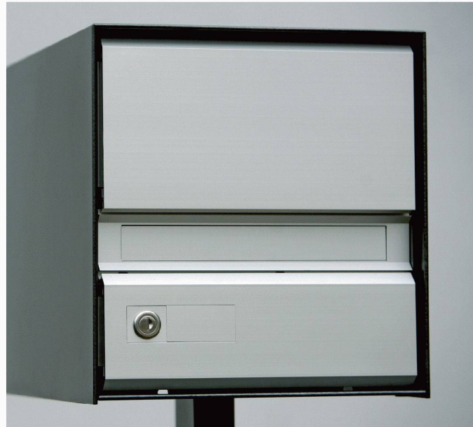
Typ classic S - Einzel - Mittelstütze

Als Spezialist für Briefkästen möchten wir Ihre Ideen und unsere Erfahrungen verbinden, um eine Lösung mit hohem Nutzwert in Funktion, Design und Preis zu erreichen.