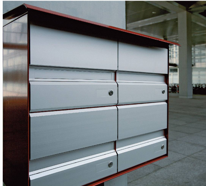
Typ classic B - Gruppe - Wandmontage - Regendach