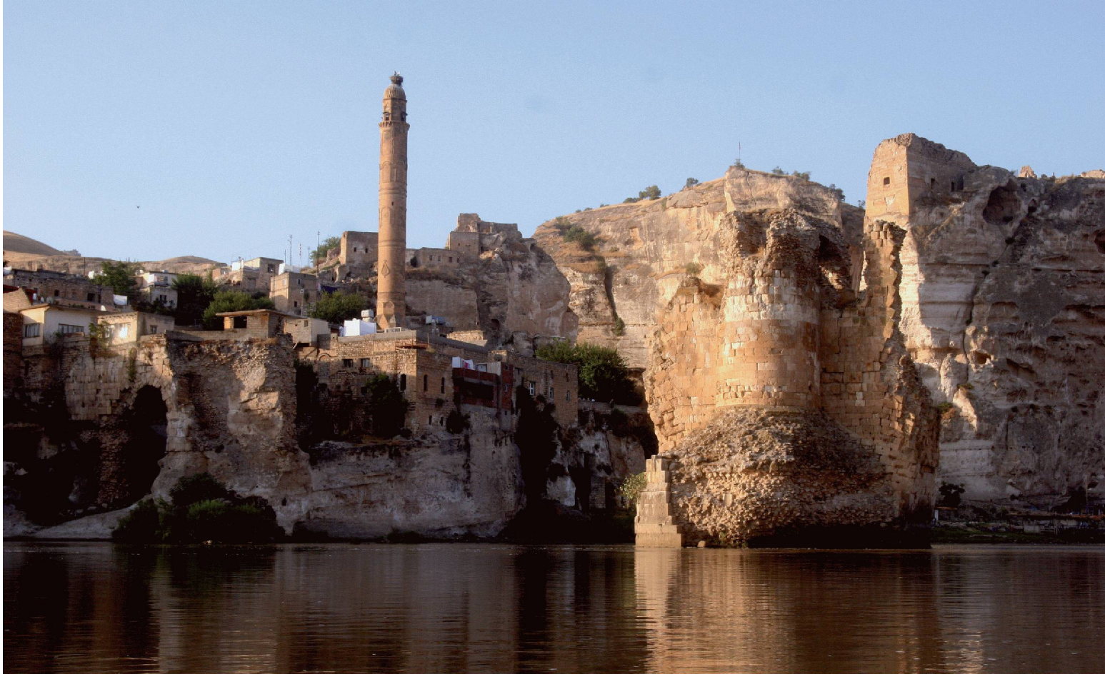
03 Die 11 000 Jahre alte Stadt Hasankeyf würde bis zur Spitze des Minarets überflutet