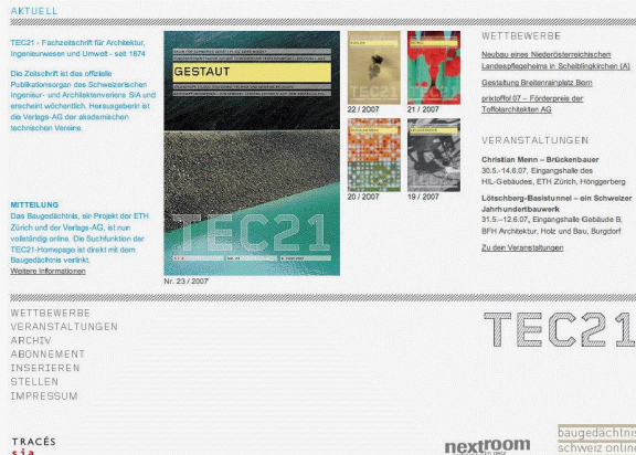
Auf der Startseite werden die aktuellen Hefte gezeigt