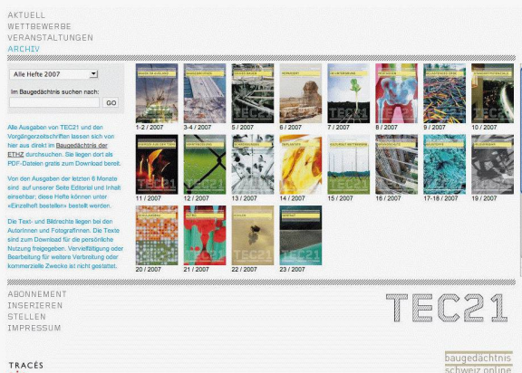
Das Archiv ist mit dem «Baugedächtnis» der ETH Zürich verknüpft, was eine detaillierte Suche in den Heftbeständen seit 1874 ermöglicht