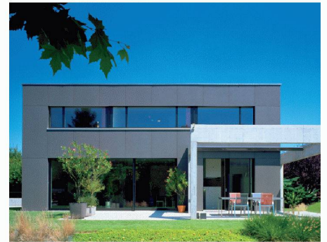
Eternit (Schweiz) AG | Halle 1, Stand A 20 www.eternit.ch

oder Renovationen, die Fassaden- und Dachlösungen von Eternit bestechen durch hohe Funktionssicherheit, Wertbeständigkeit und wirtschaftliche Nutzung über Jahrzehnte. Die äusserst dauerhaften, praktisch unterhaltsfreien Faserzementplatten schützen die Gebäudestruktur zuverlässig vor jeder Witterung. An der Messe erhalten Besucherinnen und Besucher einen Einblick in das breite Spektrum an Gestaltungsmöglichkeiten mit den Eternit-Produkten. Ein besonderes Highlight sind die neuen Fassadenfarbreihen «Nobils», «Planea» und «Terra».