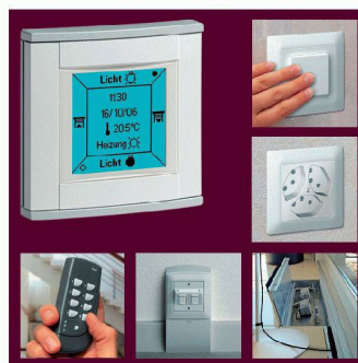
Hager Tehalit | Halle 6, Stand C 16 www.hager-tehalit.ch

Bei Renovationen und Umbauten empfiehlt Hager Tehalit das SL-Sockelleisten-System. Anschlüsse für elektrische Energie, Rundfunk- und Fernsehsignale oder Kommunikations- und Datennetze können mit sehr geringem Montageaufwand installiert werden.