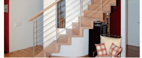
Keller Treppenbau AG | Halle 1, Stand G 02 www.keller-treppen.ch

Ahorn mit Metallsprossen aus mattem Chrom. Des Weiteren ist am Stand eine freitragende Treppe aus geöltem Eichenholz mit Sprossen in einer Holz-Metall-Kombination zu sehen. Wie auch im letzten Jahr zeigt das Unternehmen seine Metall-Holz-Treppe mit Inox-Seilen. Die Stufen sind aus Charme (Hagenbuche), farblos lackiert und versiegelt.