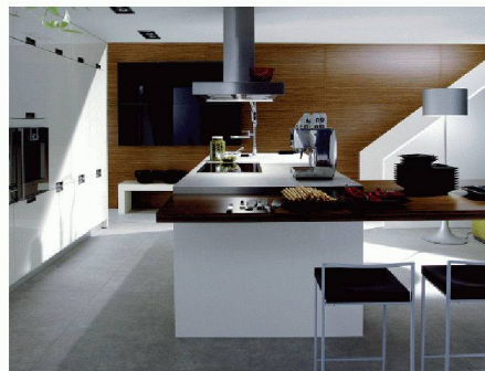
Hans Eisenring AG | Halle 3, Stand C 20 www.eisenring-kuechenbau.ch

ihre individuelle Küchenplanung dreidimensional miterleben. Die Anwendung dieser Technologie steigert die Effizienz und fördert die Kreativität und Spontaneität des Kunden während der Planungs- und Beratungsphase. Die effektiven Kosten sind im Vergleich zum Budgetrahmen jederzeit ersichtlich. An der Messe können sich Kunden von Mitarbeitern der Firma Hans Eisenring beraten lassen.