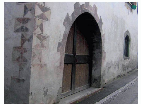
Atheco AG | Halle 2, Stand B 13 www.atheco.ch

Form von Gift- und Konservierungsstoffen zu verzichten. Der Micro-Pore-Entfeuchtungsputz ist hoch wasserdampfdurchlässig und sorgt für eine dauerhafte Abtrocknung von feuchten Mauern. Durch die spezielle Mikroporen- und Kapillarenstruktur verdunstet das im Mauerwerk befindliche Wasser sehr schnell, und gleichzeitig wird der Weitertransport von Wasser in flüssiger Form verhindert. Die Salze gelangen somit nicht an die Oberfläche. Problemwände sowohl im Innen- wie im Aussenbereich können mit diesem Produkt nachhaltig und kostengünstig saniert werden.