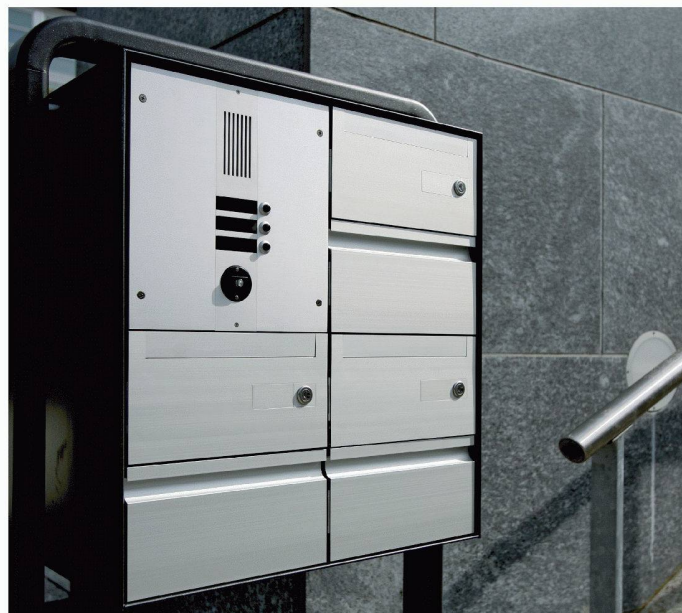
Typ deluxe S - Gruppe - Jochstütze - Sonnerie