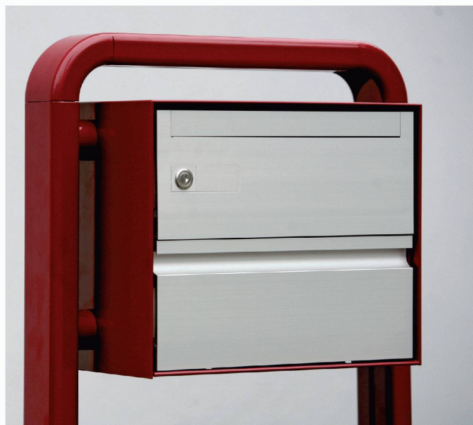
Typ deluxe B - Einzel - Jochstütze

Als Spezialist für Briefkästen möchten wir Ihre Ideen und unsere Erfahrungen verbinden, um eine Lösung mit hohem Nutzwert in Funktion, Design und Preis zu erreichen.