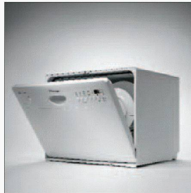
Die kompakte Lösung.