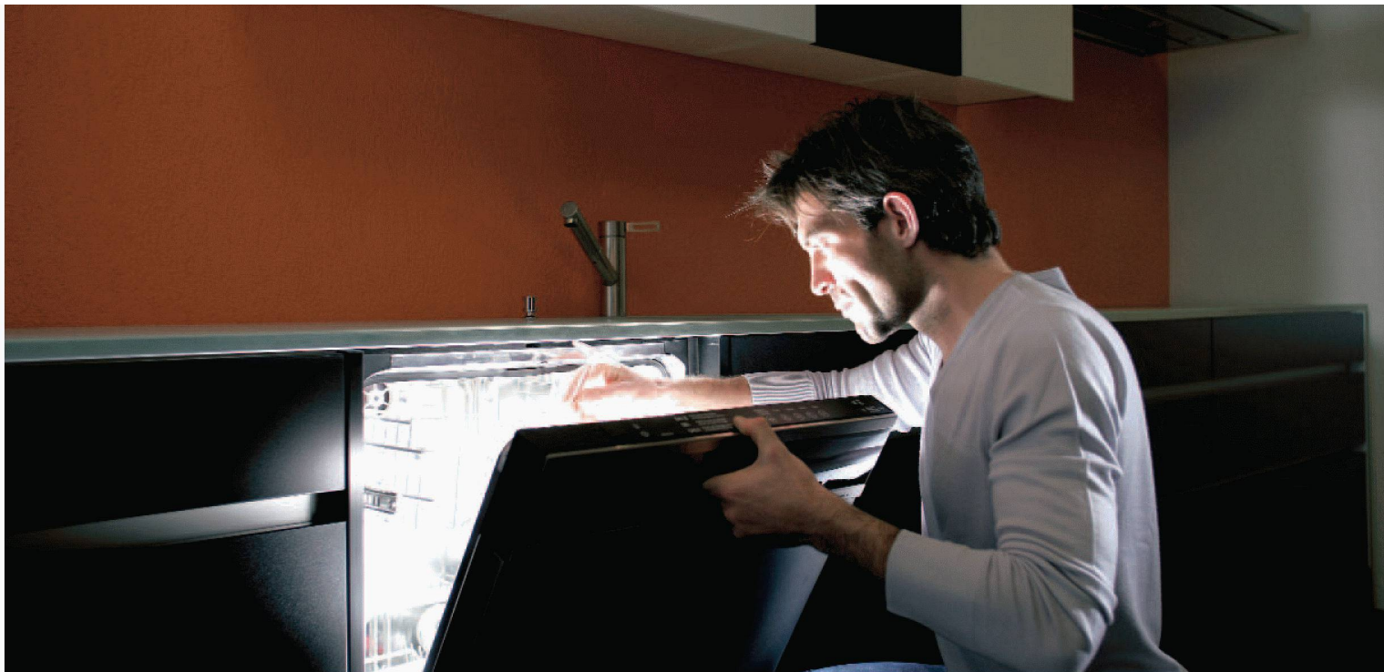
Einfach schön, wenn Teller und Gläser im richtigen Licht erscheinen: Die komfortablen Electrolux-Geschirrspüler machen es möglich.