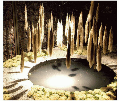
01–03 Grüner, roter und schwarz-weisser Garten (Bilder: Franziska Huber/Schellenberg Gartenbau, Bülach)

«Grüner Garten», «roter Garten», «schwarz-weisser Garten» – eine Umfriedung aus Gabionenwänden bildet das Grundelement der drei Gartenkreationen der Landschaftsarchitektin Franziska Huber.