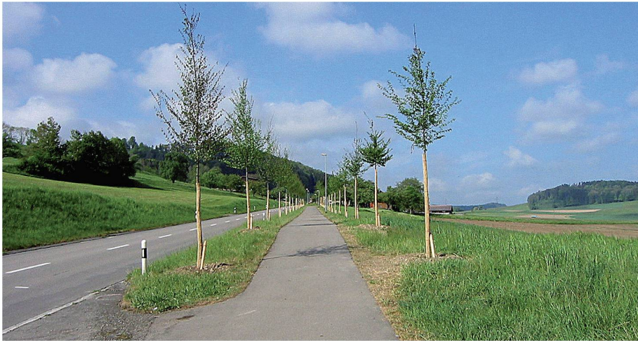
01 Neue Allee an der Kantonsstrasse in Wängi. Die Thurgauer Gemeinde hat die Alleen-Kampagne genutzt, um ihre Dorfeinfahrten aufzuwerten

Im Jahr 2006 startete der Fonds Landschaft Schweiz (FLS), der sich der Erhaltung und Aufwertung naturnaher Kulturlandschaften verschrieben hat, eine Alleen-Kampagne. 1 Damit will er landschaftsprägende und ökologisch wertvolle Alleen und Baumreihen fördern.