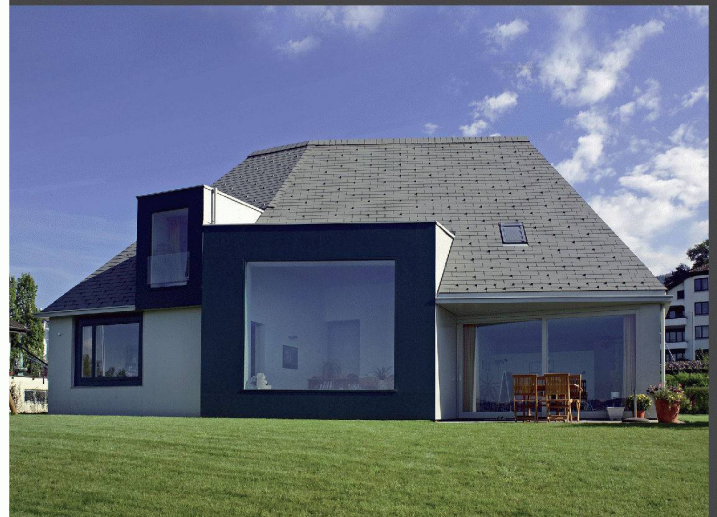
Pool Architekten, Zürich

Mit einer eigenständigen Dachgestaltung Zeichen setzen. Unkonventionelle Ideen verwirklichen. Mit Struktur und Farbe spielen. Eternit Dachschiefer bietet nahezu unbegrenzte Möglichkeiten dazu.