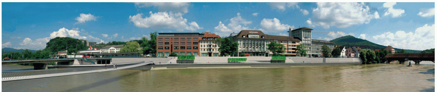
04 Siegerprojekt «Doppelpass»: Blick auf das östliche Aareufer mit der neuen Spannbandbrücke zum Bahnhof (werk1 architekten und planer, Olten)