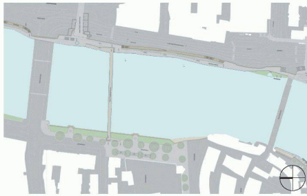
01 1. Rang (55 000 Fr.): «Doppelpass», werk1 architekten und planer, Olten; grünwerk1 landschaftsarchitektur, Olten; Fürst Laffranchi Bauingenieure, Wolfwil; Verkehrsplanung Freycon, Olten