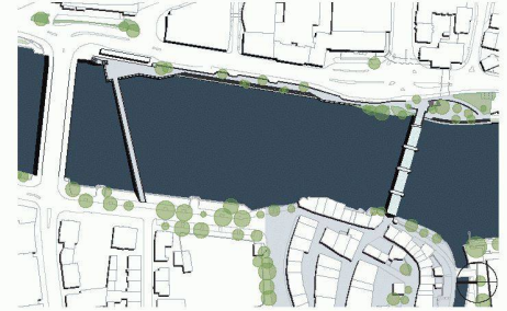
03 3. Rang (20 000 Fr.): «St. Martin», Mettler Landschaftsarchitektur, Gossau; AV1 Architekten, Kaiserslautern (D); BKM Ingenieure, St. Gallen; Lichtplanung: Conceptlicht at, Mils/Innsbruck (A)

(af) Bereits letztes Jahr hat die Stadt Olten einen einstufigen Projektwettbewerb für interdisziplinäre Planungsteams aus den Bereichen Landschaftsarchitektur, Architektur/Städtebau und Bauingenieurwesen auslobt, um ein Freiraumkonzept für das innerstädtische Aareufer und Ideen für die anschließenden Uferbereiche zu erhalten. Von 18 abgegebenen Arbeiten erreichten die drei rangierten Projekte den letzten Rundgang. Einstimmig empfahl die Jury den Beitrag «Doppelpass» von werk1 aus Olten zur Weiterbearbeitung und Ausführung. Die Verfasser schlagen vor, den Fussweg am östlichen Aareufer heraufzusetzen und zu einer breiten Promenade auszubauen. Neben Sitzstufen schliesst südlich ein hochwassersicheres «Aarebistro» an. Spektakulärstes Element aber ist der neue Fussgängersteg: Stützenfrei überbrückt eine filigrane Spannbandkonstruktion die gut 100 m über den Fluss vom Bahnhof zur Innenstadt. Der modulare Aufbau aller Massnahmen ermöglicht dabei eine schrittweise Umsetzung. Nach der Ausstellung der Wettbewerbsarbeiten setzten die Oltener bereits den Fussgängersteg und das Bistro ganz oben auf ihre Wunschliste.