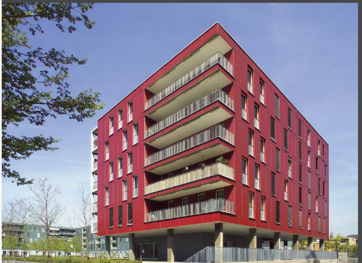
Architekten: Tina Arndt, Daniel Fleischmann, Zürich

Die Auseinandersetzung mit Funktion, Raum und Proportionen als kreativer Prozess. Die Wahl des Materials als entscheidendes Element einer konsequenten Umsetzung.