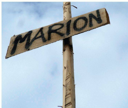
01 Keine Orientierung ohne Signaletik

(pd/jk) Die Hochschule der Künste in Bern (HKB) führt einen «Certificate of Advanced Studies»(CAS)-Lehrgang in Signaletik durch. Die berufsbegleitende Weiterbildung führt in die Signaletik ein und erschliesst deren Systematik. Die Studierenden lernen, historische und aktuelle Lösungen zu analysieren und sich so ein systematisches Instrumentarium