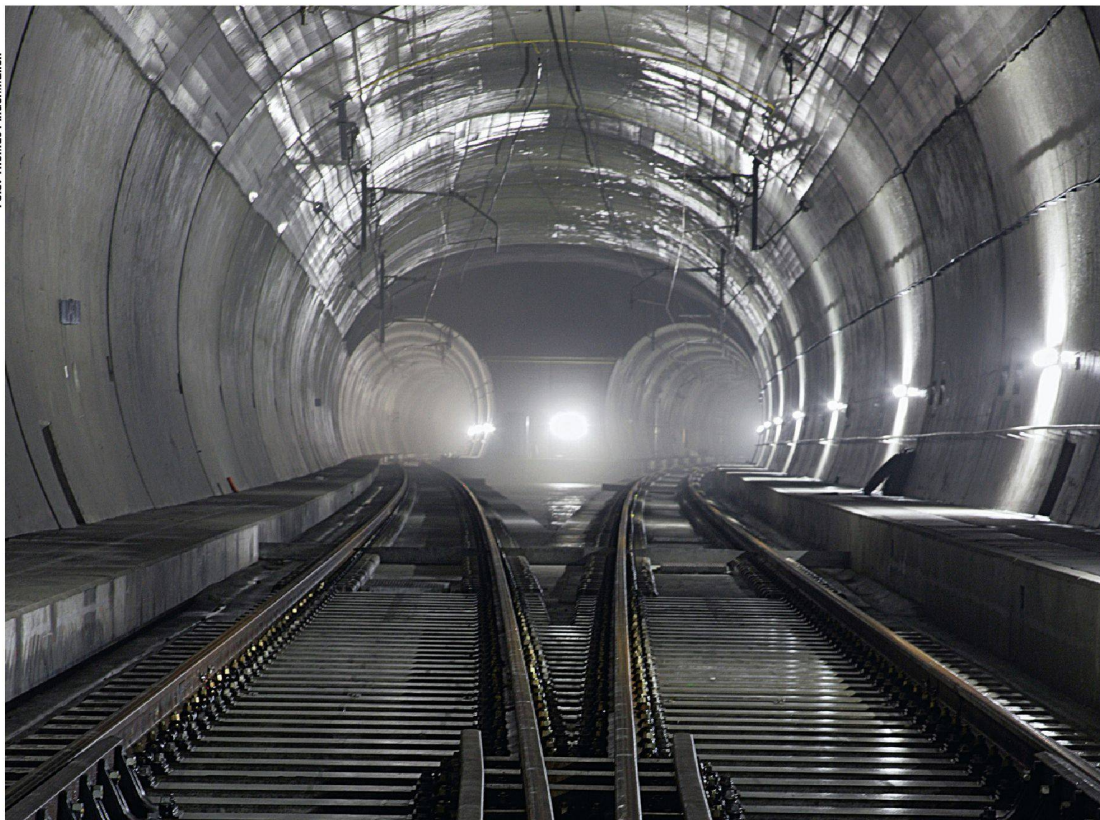
[Im Lötschberg-Eisenbahntunnel: über 1000 km Hoch-, Mittel- und Niederspannungskabel sowie fast 1500 km Sicherheits- und Telekommunikationskabel]