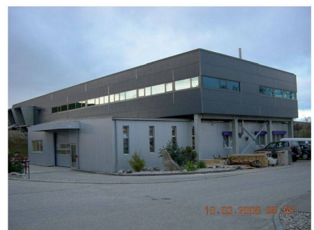
Die neue Halle über der bestehenden