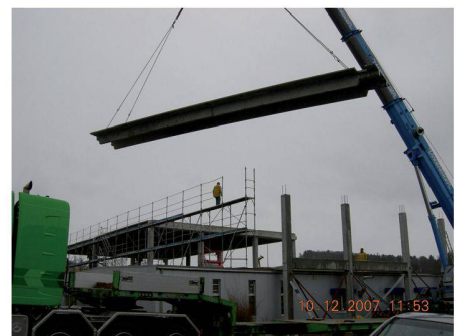
Montage der Rippenplatten direkt ab LKW

Weitere Informationen: Elementwerk BRUN AG 6032 Emmen Tel. 041 269 40 79 www.brunag.ch