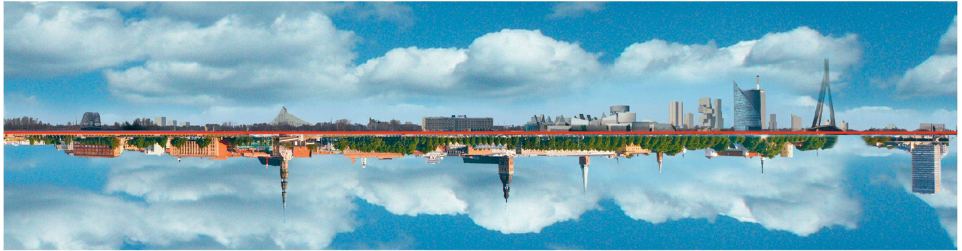
01 Riga: zwischen Welterbe und Moderne

Unesco-Welterbe seit 1997 und «künftige Weltstadt moderner Architektur»: Riga hat sich viel vorgenommen. Dass die lettische Hauptstadt aber nicht nur baulich über ein enormes Entwicklungspotenzial verfügt, stellte sie angesichts des diesjährigen Welttags der Architektur eindrücklich unter Beweis.