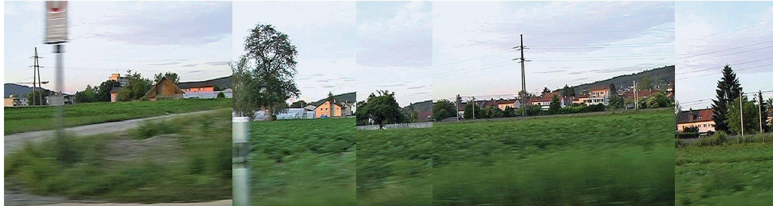
01 Experimentelle Landschaftsplanung kann auch auf der Ebene der Repräsentationen sichtbar gemacht werden. Bildstreifen einer Siedlungslandschaft in Zürich Affoltern