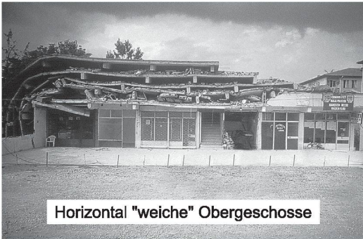
Horizontal "weiche" Obergeschosse