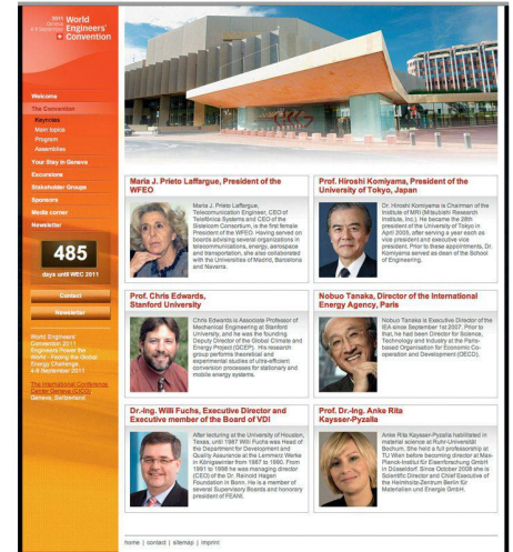
01 Screenshot der WEC-2011-Website www.wec2011.ch

WEC 2011 bleiben möchte, hat die Möglichkeit, sich auf der Website zu registrieren.