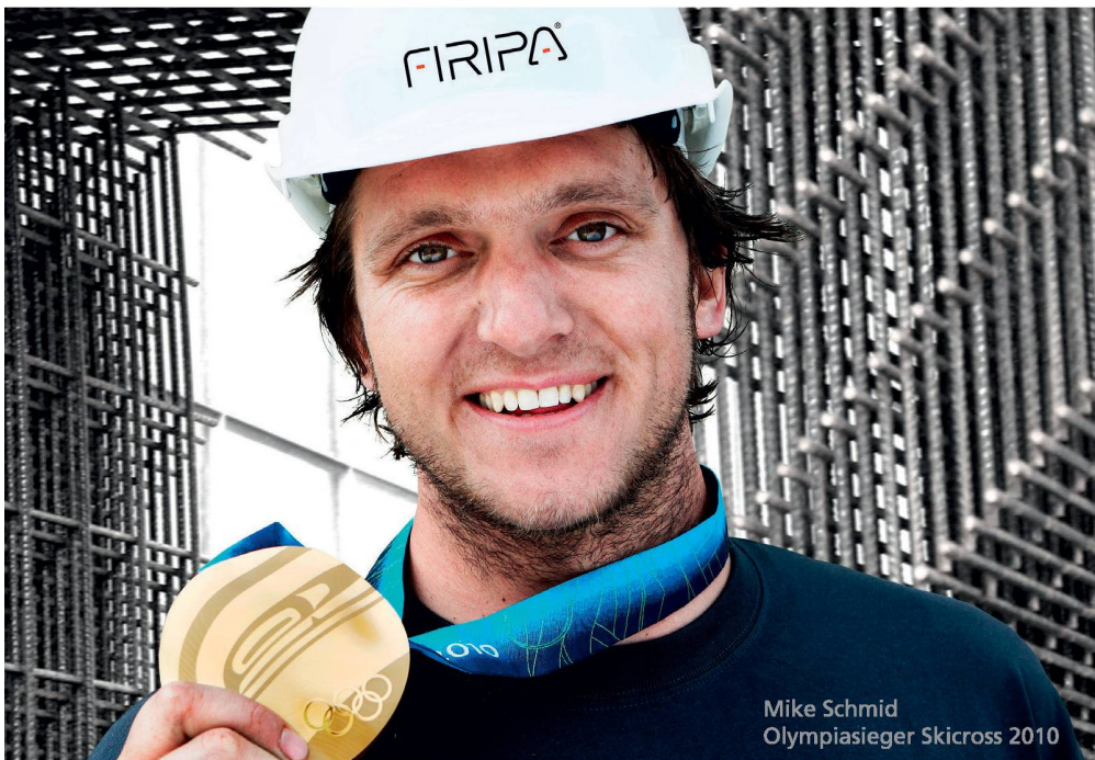
Mike Schmid Olympiasieger Skicross 2010