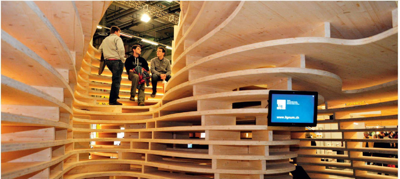
01 Frei + Saarinen Architekten entwarfen im Auftrag der Lignum einen neuen Messestand, der an der Swissbau in Basel im Januar 2010 erstmals zu sehen war und jetzt auch in Bern stehen wird (Halle 210, Stand E20)