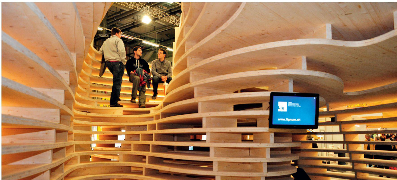
01 Frei + Saarinen Architekten entwarfen im Auftrag der Lignum einen neuen Messestand, der an der Swissbau in Basel im Januar 2010 erstmals zu sehen war und jetzt auch in Bern stehen wird (Halle 210, Stand E20)