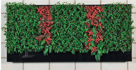
01 Grafisches Motiv mit Akzenten

Das Institut für Umwelt und natürliche Ressourcen der Zürcher Hochschule für Angewandte Wissenschaften (ZHAW) hat ein System für vertikale Innenraumbegrünungen entwickelt. Das Besondere: Das lebende Bild kommt ohne Pumpe, Wasser- und Stromanschluss aus.