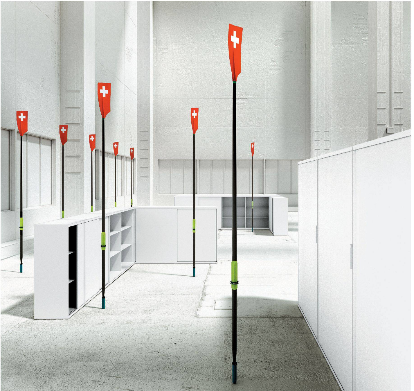
Stauraumsystem LO One

Lista Office LO in Ihrer Nähe > www.lista-office.com/vertrieb