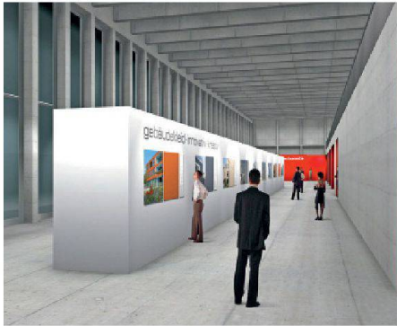
01 Visualisierung der Sonderschau

Themen der fünften «Appli-Tech», der Schweizer Leitmesse für das Maler- und Gipsergewerbe, für Trockenbau und Dämmung, sind Gebäudehüllen und Wohnraumklima.