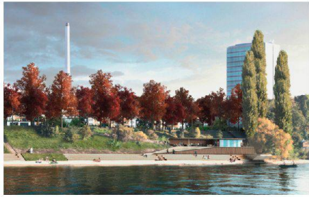
02 «Vierklang»