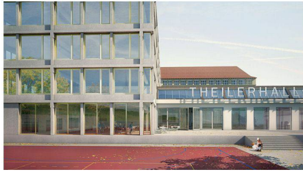
04 «Richard 1»: direkter Anbau (Meier Hug)

Bau, Luzern; SYTEK, Binningen; Bakus Bauphysik & Akustik, Zürich