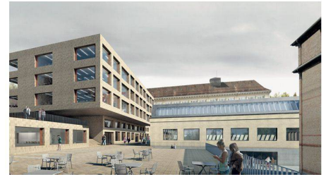
05 «Tegula»: gerade Schneise (giuliani.hönger)