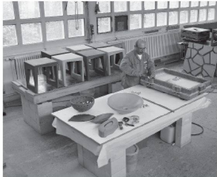
In der Beton-Manufaktur im Werk Einigen.

Seit der Integration der Kanderkies AG in die Vigier Holding erfolgt der Kiesabbau und die Betonproduktion durch die Vigier Beton Berner Oberland, während sich Creabeton Matériaux AG auf die Herstellung von Betonwaren spezialisiert hat. Belegschaft und Firmenleitung kennen die Bedürfnisse der regionalen Märkte und können rasch auf Kundenwünsche reagieren. Als Besitzer des Kanderdel-tas mit seinen Auenwäldern und Flachwasserzonen nehmen die Vigier-Unternehmen eine grosse Verantwortung für die Erhaltung der Lebensräume bedrohter Tiere und Pflanzen wahr. Die ökologischen Leistungen der Kies- und Betonbranche werden auch von den Behörden und den Umweltorganisationen anerkannt, mit denen die beiden Unternehmen in Einigen eng zusammenarbeiten.