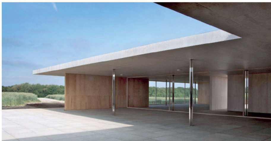
Nachbau des von Ludwig Mies van der Rohe 1930 in Krefeld geplanten Golfklubhauses. Den Initianten war es wichtig, den Bau am Originalstandort zu zeigen. Wegen eines Naturschutzgebiets ist er nun um 300 m verschoben.

Ludwig Mies van der Rohes 1930 entworfenes und nie realisiertes Golfklubhaus im nordrhein-westfälischen Krefeld wurde diesen Sommer als begehbare Modell nachgebaut. Bis zum 27. Oktober lässt sich der Bau besichtigen. Zurückhaltend materialisiert macht er die Essenz von Mies' Gedankengut erlebbar.