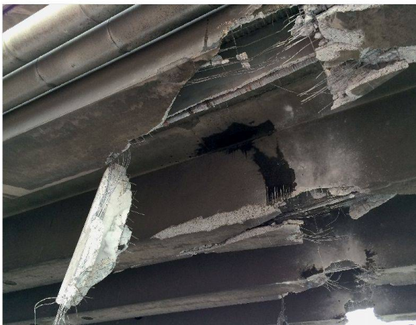
Der Ausleger zerschneidet die Hohlkastenträger. Die Hüllrohre mit den Vorspannkabeln wurden freigelegt, aber nicht verletzt.