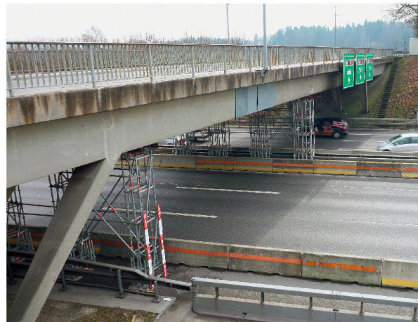
Die Sicherung besteht aus Gerüsten mit Anprallschutz auf den Mittel- und Pannestreifen sowie Abdeckblechen beim Schaden.