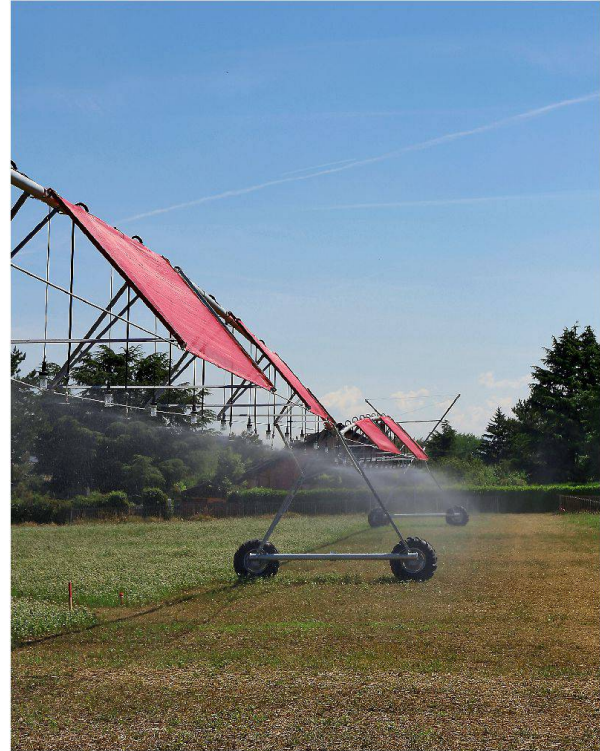
Schatten, Licht und Wasser für die Ackerblumen und für eine schönere Landwirtschaft: Sous le grand portique .

Der Weg führt weiter zu einer anderen typischen Stadtrandssituation, zu Schuppen und Lagerplätzen kleiner Baufirmen. Hier wird am Samstagmorgen geschweisst und gehämmert. In dieser profanen Um-