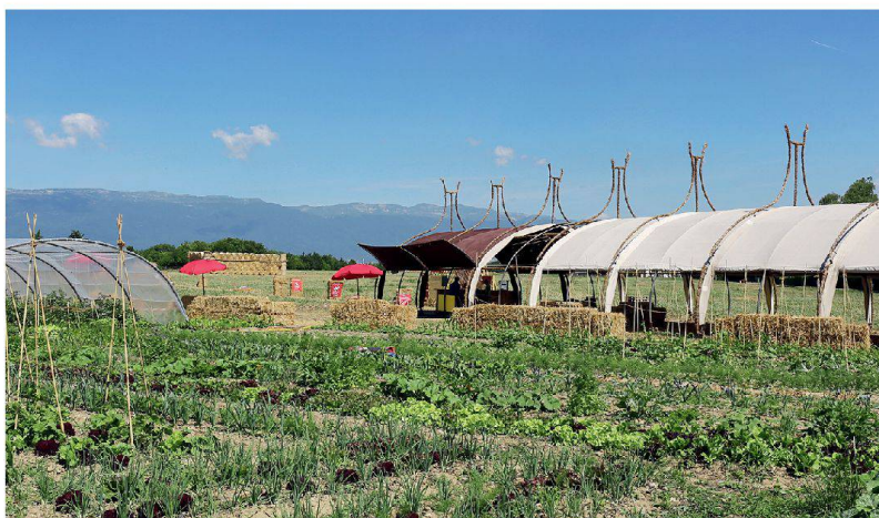
Im Feldrestaurant in Bernex wird gegessen und getrunken, was die Region hergibt.