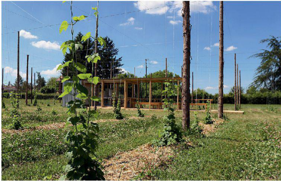
Trinken und lernen auf dem Champ de bière .