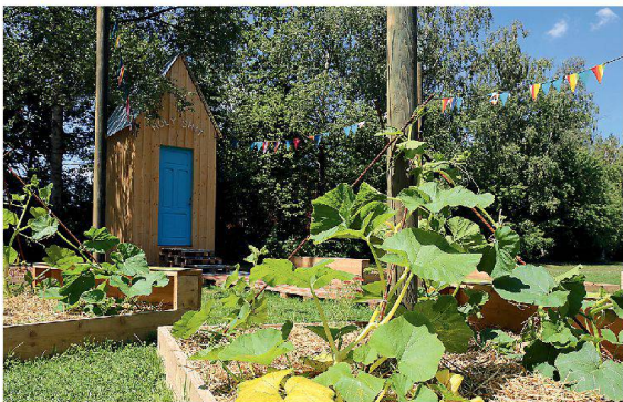
Göttlicher Kreislauf im Jardin digestif .

Ackerblumen vertilgt, die Arbeit mit den Händen und Nutztieren verdrängt, sodass manchenorts nur geometrisch geordnete Monokulturen geblieben sind. Doch, vermutlich ist eine Reästhetisierung der Nahrungproduktion nötig.