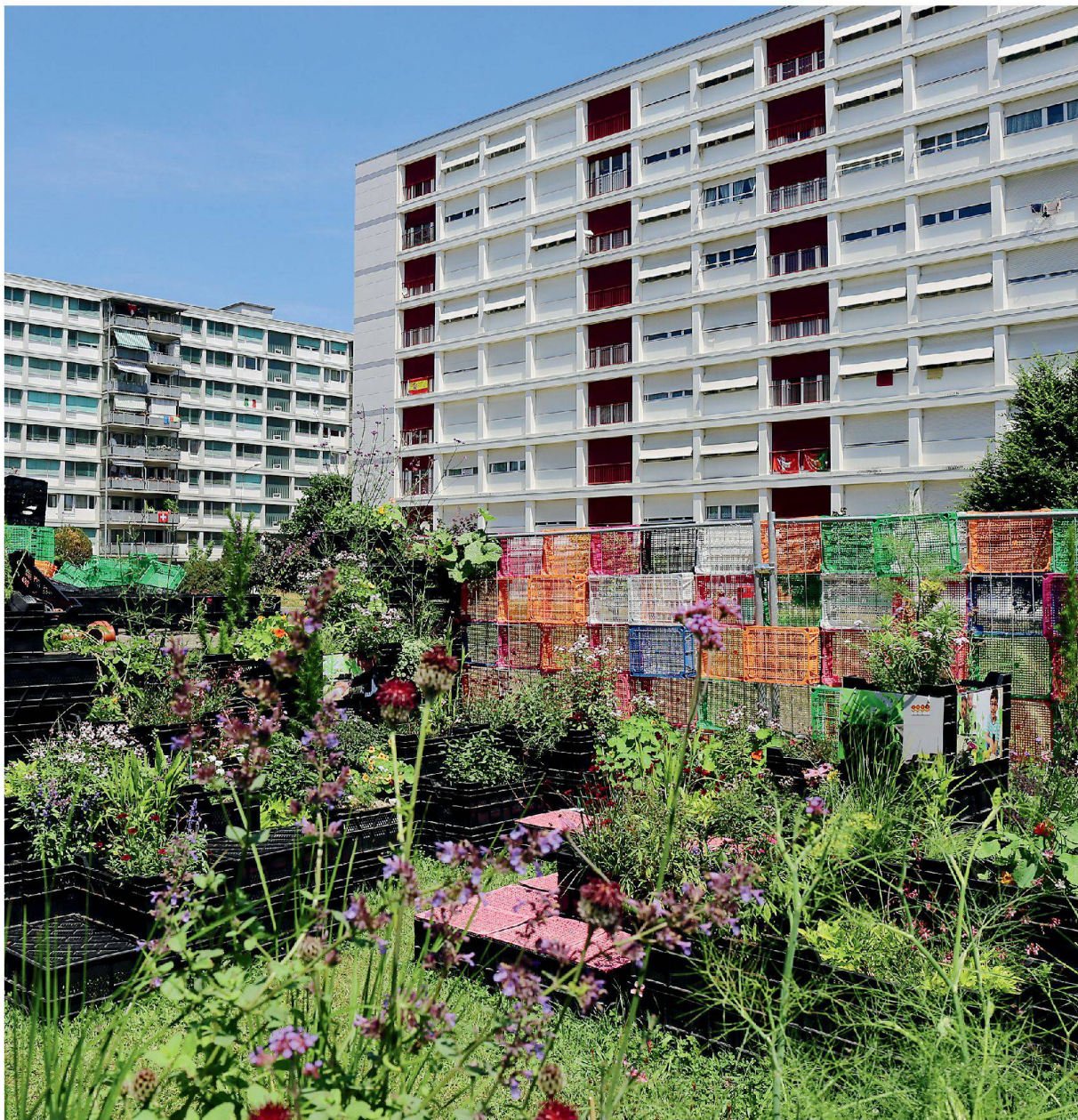
Label Cité: Eine neue Aufgabe für den Stadtraum der Moderne postuliert diese bunt bepflanzte Harassenburg in Onex Cité bei Genf.

Text: Pauline Rappaz und Ruedi Weidmann