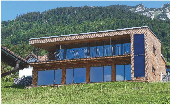
Plusenergie-Ferienhaus in Amden, Energiebezugsfläche 176 m 2