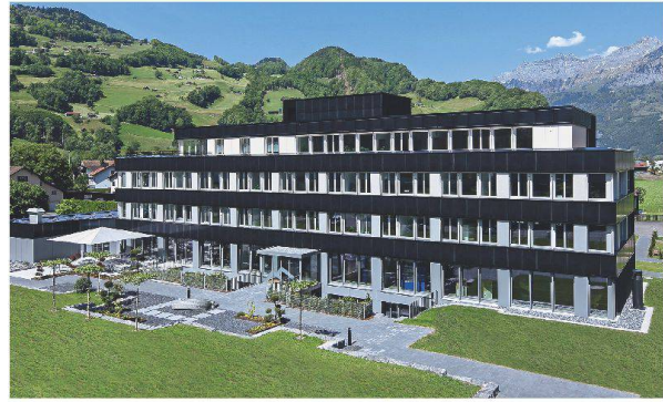
Verwaltungsbau Flumroc in Flums, Energiebezugsfläche 2995 m 2

Neubau-EFH: Das 114 m 2 grosse Pultdach ist vollflächig mit PV-Modulen eingedeckt. Das kühle Grau der monokristallinen Wafer harmonisiert elegant mit der modernen Architektur.