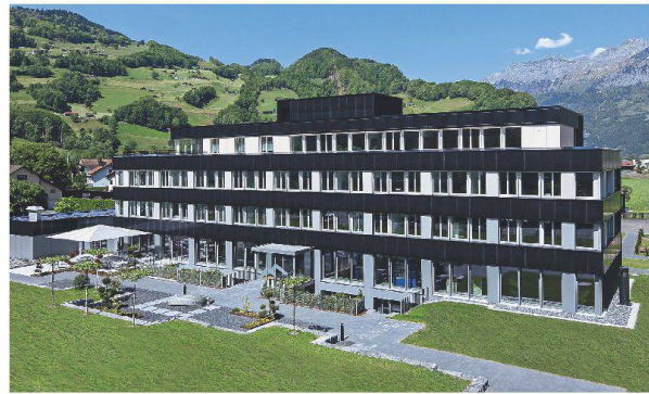
Verwaltungsbau Flumroc in Flums, Energiebezugsfläche 2995 m 2

Neubau-EFH: Das 114 m 2 grosse Pultdach ist vollflächig mit PV-Modulen eingedeckt. Das kühle Grau der monokristallinen Wafer harmonisiert elegant mit der modernen Architektur.