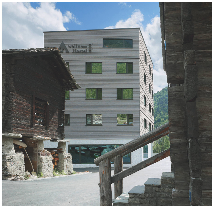
Zwei Arten Speicher: die historischen Stadel und die neue Herberge.

2009 spannten die Schweizer Jugendherbergen und die Burgergemeinde in einer Public Private Partnership zusammen und schrieben einen Studienauftrag für das Projekt aus. Der Standort war zwar durch das Hallenbad vorgegeben, aber dennoch ideal: neben der Postautostation und nur wenige Minuten von der Talstation der Bergbahnen entfernt, hoch über der 300 m tiefen Schlucht der Fee-Vispa. Realisieren durfte den Bau das Basler Architekturbüro Steinmann & Schmid.