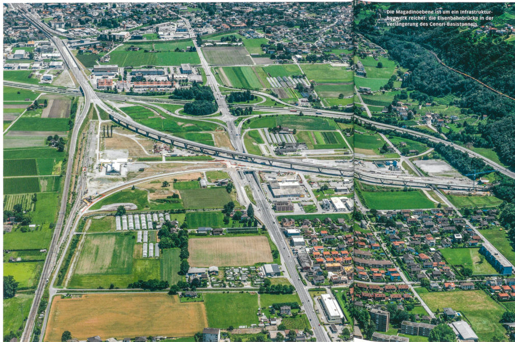
Die Magadinoebene ist um ein Infrastrukturbauprogramm reicher: die Eisenbahnbrücke in der Verlängerung des Gotthard-Basistunnels.