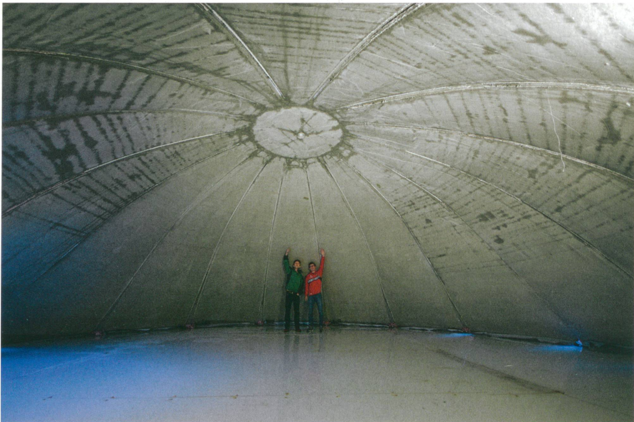
Die fertiggestellte Schale hat im Innern eine Höhe von 3.5 m, ihre Fugen sind mit Mörtel verspachtelt.

Nach dem Aushärten wurde die Betonplatte zu einer zweifach gekrümmten Schale verformt. In der ersten Phase wurde die Platten-