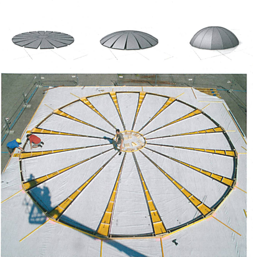
Eine Kreisplatte ist durch keilförmige Aussparungen in einzelne Segmente geteilt, die sich beim Krümmen zu einer Schale zusammenschließen.

mitte durch Aufblasen des Hebekissen bis auf eine Höhe von 90 cm angehoben. Der angewendete Luftdruck (16 bis 17 bar) war dabei leicht höher als der aus dem Eigengewicht der Platte resultierende Druck.