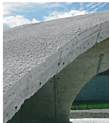
Die Betonplatte ist 5 cm dick. Darüber befindet sich eine Spritzbetonschicht.

nötig. Beim Schalenbau kann in Radialrichtung eine Krümmung der Segmente erzielt werden, wenn diese ausreihend angehoben werden. Die Endform entspricht der angestrebten Form, denn die Abweichung zur idealen Kuppel beträgt im Umfang maximal 72 mm ( L/140 ) und in der Mitte maximal 17 mm ( L/600 ). Dabei kommt es zu starken Rissbildungen: Mit einem geschätzten mittleren Elastizitätsmodul von E=1124 MPa werden kaum 5% des Werts von nicht gerissenem Beton der Klasse C25/30 ( E=26700 MPa) erreicht. Es ist aber möglich, die gekrümmte Schale mit einer Bewehrungs- und einer Spritzbetonschicht zu ergänzen. Die Verstärkung erhöht die Steifigkeit und Festigkeit durch Überbrücken der unbewehrten Fugen. (te)