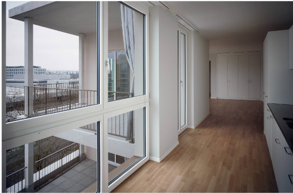
Unterschiedliche Grundrisse mit (fast) einheitlicher Ausstattung (oben: Haus B; unten: Haus K).