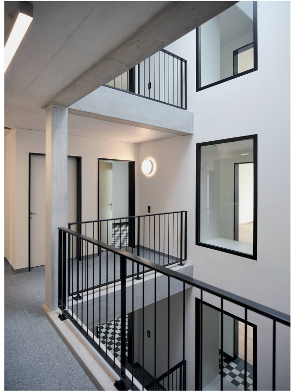
Die innere Erschliessung mit Ein- und Ausblicken für ein gemeinschaftliches Miteinander (Haus B).