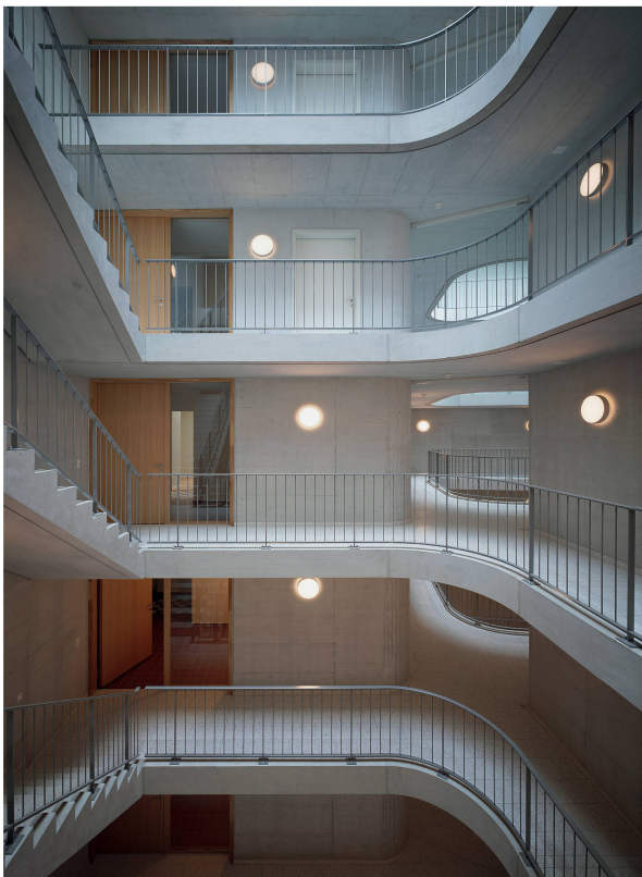
Grosszügige, offene Treppenhäuser als Antwort auf die tiefen Gebäudevolumen (Haus K).