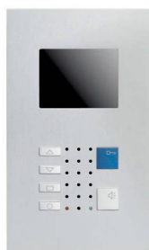
VTC40 / Alu