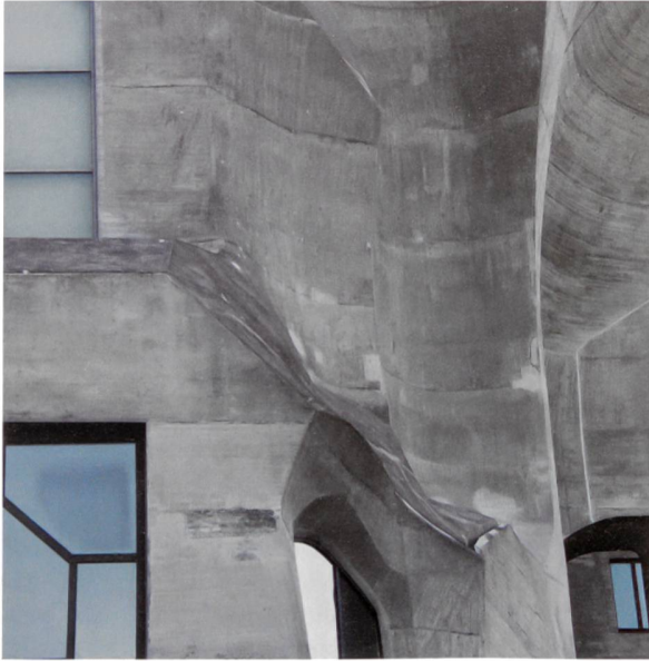
Die originale Sichtbetonfassade wurde 2014–2015 verhältnismässig und unter Einhaltung der denkmalpflegerischen Anforderungen bearbeitet (4150 m 2 ). Mit einem Preis von 85 Fr./m 2 Sichtbetonfläche waren die Arbeiten auch kostengünstig (exklusive Gerüstkosten von 65 Fr./m 2 , die der Instandsetzung des Dachs zugeordnet wurden).

Haftzugfestigkeit von 2.8 N/mm 2 . Aufgrund dieser Nachforschungen und Testergebnisse wurden Betonrezepturen erstellt und vor Ort bemustert – ein Findungsprozess, der beinahe ein halbes Jahr in Anspruch nahm.