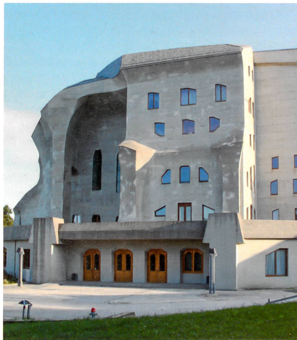
Goetheanum: Formensprache der Betonskulptur mit inhärenter Schalbrettstruktur und Licht-Schatten-Effekten.

Der Sichtbetonbau erscheint als ein massiver Block mit windschief gekrümmten und gewölbten, monolithisch verwachsenen Wand- und Dachflächen sowie mit scharfkantigen Graten. Details wie in die Fassaden eingelassene, abgekantete Pfeiler, abgeschrägte Fensteröffnungen und mehrfach geknickte Dachplatten charakterisieren das Bauwerk, das mit seinen expressiven und plastischen Formen organisch wirkt. Diese Formen sollten ein Ausdruck des kreativen und freien Gestaltungsprozesses Steiners sein, der allerdings kurz nach Bau-