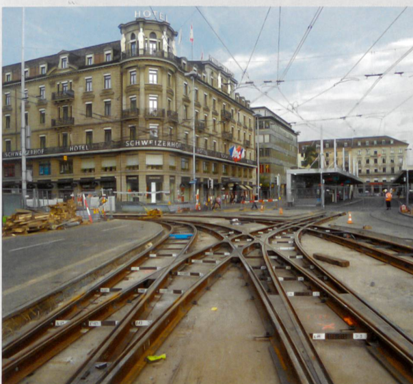
Gleisersatz Bahnhofplatz, Zürich

Weitere Informationen finden Sie unter www.emchberger.ch