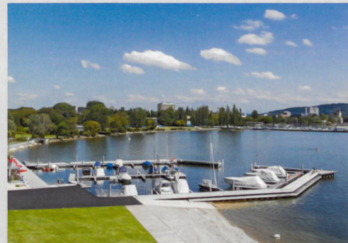
Oben: Um- und Neubau Stadtspital Triemli, Zürich Unten: Beaurivage, Biel

Hochschulen. Zudem investieren wir viel in die Förderung und Weiterentwicklung unserer Mitarbeitenden. Weitere Kernelemente, die uns zu einem attraktiven Arbeitgeber machen, sind unsere interessanten, komplexen und multidisziplinären Projekte sowie unsere Arbeitsbedingungen.