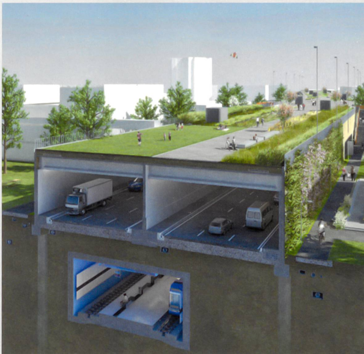
Einhausung Schwamendingen, Zürich (Visualisierung)