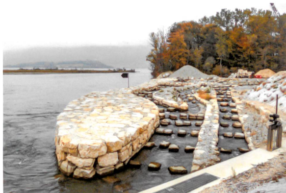
Das Umgebungsgewässer bietet kleineren und grösseren Fischen verschiedene Auf- und Abstiegsmöglichkeiten an.