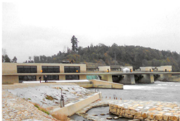
Das Maschinenhaus ist in das Wehr integriert. Über die Wehrbrücke führt eine beliebte Veloroute entlang des Bielersees.

Als weitere ökologische Massnahme wird der ehemalige Unterwasserkanal in eine Auenlandschaft umgewandelt. Auch an wandernde Käfer hat man gedacht. Ein in die Wehrbrücke integrierter Kiesstreifen soll die Querung erleichtern. Die Kosten der ökologischen Massnahmen belaufen sich auf knapp 10% der gesamten Investitionskosten von rund 150 Mio. Franken.