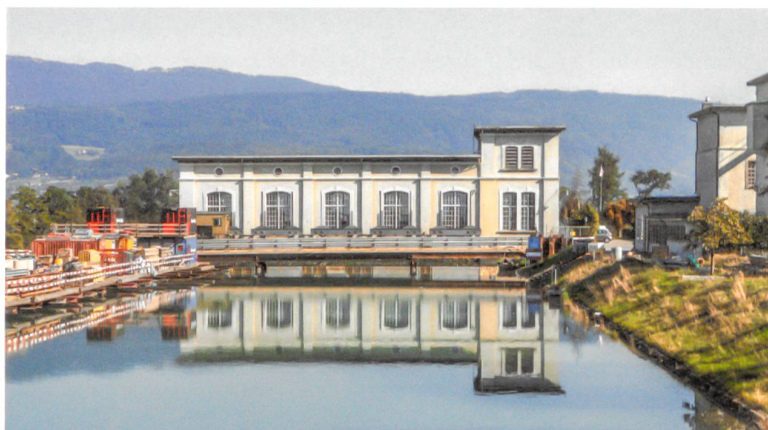
Im alten Maschinenhaus bleibt eine Turbine in Betrieb. Künftig dient das Gründungskraftwerk der BKW Schulklassen und Besuchern als Anschauungsobjekt.