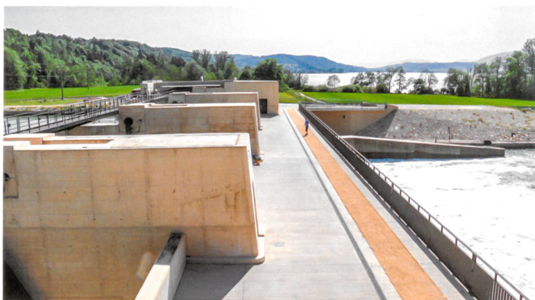
Das neue Kraftwerk nimmt den Farbtönen des Molassefelsens in der Umgebung auf und fügt sich damit harmonisch ins Gesamtbild.

Energie des Kantons Bern, nicht gelten. Ohne Berücksichtigung der Ökologie könne heute gar nichts mehr gebaut werden. Die Regierungsrätin ist fest davon überzeugt, dass die Wasserkraft in der Schweiz die wichtigste Stromerzeugungsquelle bleibt und die aktuelle Krise überwunden wird. Derzeit ist nur nicht klar, wie. Eine kluge Politik und vielleicht auch andere Rahmenbedingungen sind nötig, damit Wasserkraft, Natur, Landschaft und unsere Denkmäler nicht auf der Strecke bleiben. Und damit darüber hinaus die Chance besteht, dass gute Architektur entstehen kann. •