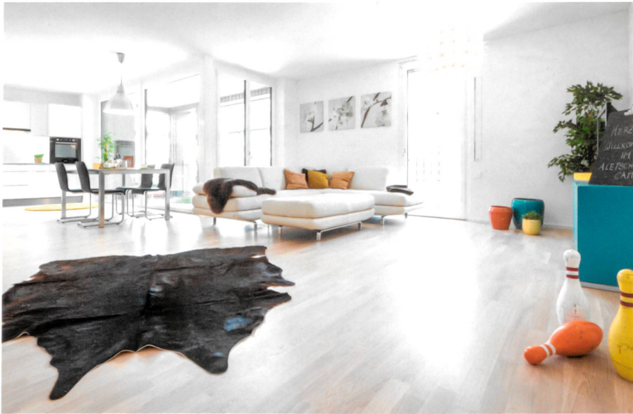
199 Ego®Fresh Mehrraum-Lüftungssysteme im MINERGIE® Referenzobjekt Aletsch Campus, Naters.

Intelligente Lüftungssysteme liegen im Trend; dabei werden dezentrale Einzelraumlüftungsgeräte aus mehreren Gründen immer interessanter. Eine dezentrale Lüftung wie Ego®Fresh ist einerseits aufgrund der einfacheren Planung und den geringeren Baukosten kostengünstiger als ein zentrales System. Andererseits eignet sich Ego®Fresh auch hervorragend bei Sanierungen.