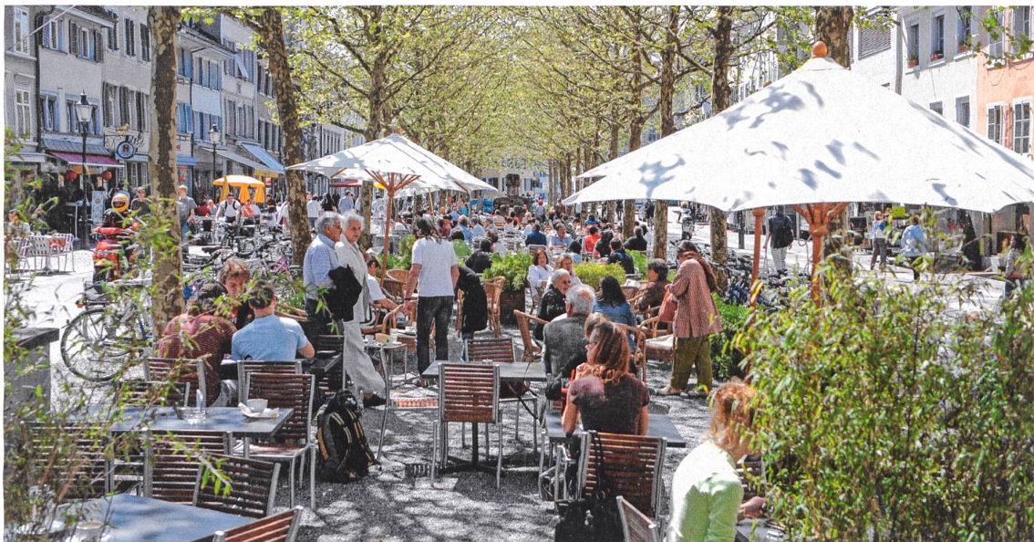
80 Jahre später ist der grüne Mittelstreifen des «Grabens» ein einziger grosser Café-Freisitz, gerahmt von Fussgängerzonen.